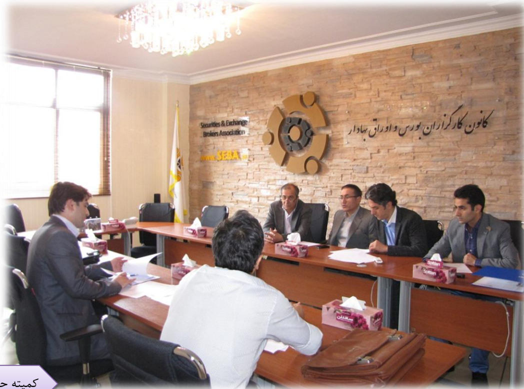
کمیته حل اختلاف

این کمیته پایان رسیدگی را اعلام و نهایتاً شخص وابسته به عضو با عضو توافق کرد یک ماه دیگر نیز به همکاری با کارگزاری مطابق قرارداد استخدامی ادامه دهد. بنابراین با توجه به توافق صورت گرفته کمیته اقدام به صدور رأی نمود.